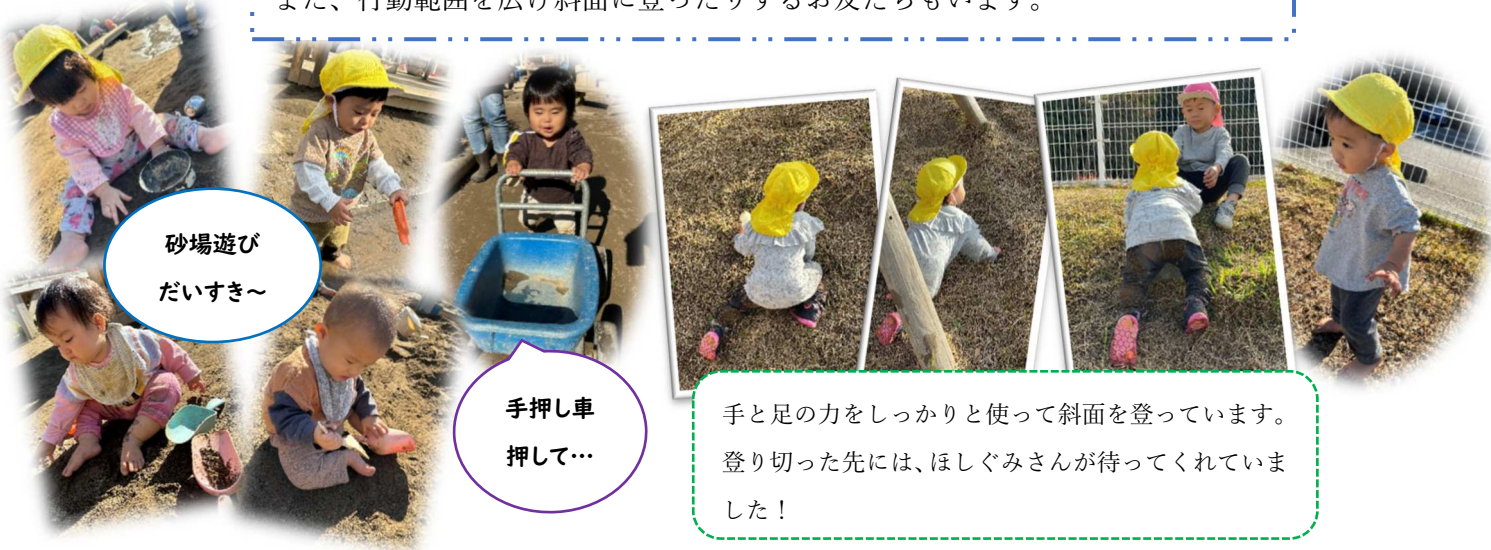
砂場遊び だいすき～

ひよこ組さんも園庭で遊ぶお友だちが増えました！今まではテラスで過ごすことが多かったお友だちも園庭の砂場等で遊ぶ様子が見られるようになりました。また、行動範囲を広げ斜面に登ったりするお友だちもいます。